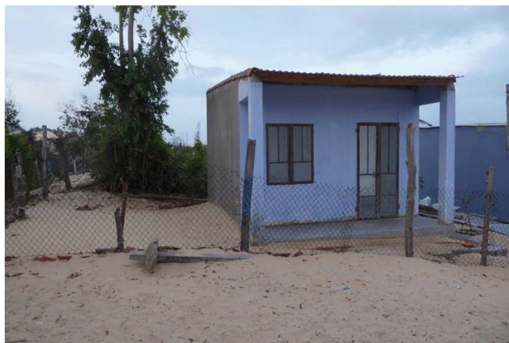
Nos deux dernières constructions de cette année