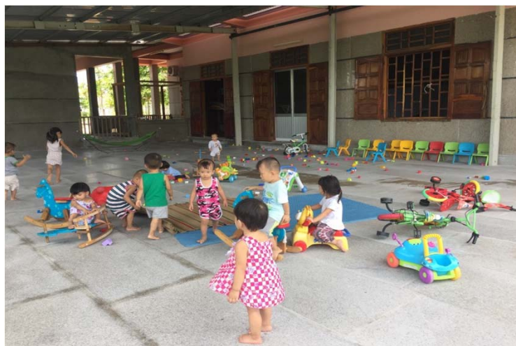
La place de jeux a été finie en octobre, elle est maintenant bien utilisée par les enfants de l'orphelinat.